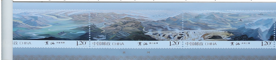
《黄河》大邮票:长(480cm)×宽(30cm)九枚连印(部分展示,全景更恢宏)