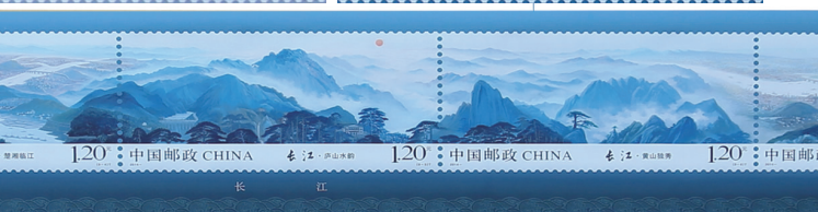
《长江》大邮票:长(480cm)×宽(30cm)九枚连印(部分展示,全景更恢宏)