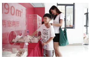
东史马村村民在抽签分房

近日,枫杨办事处东史马村城中村改造项目二期工程安置房分房工作在东史马村安置小区新村委会顺利开展。