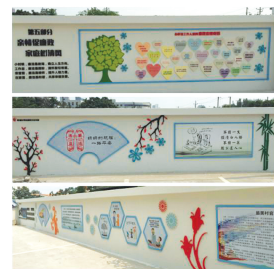
梧桐办事处文化长廊

记者在现场看到,梧桐办事处“廉政文化长廊”全长170多米,以廉政文化建设为主线,从风气养成、职业精神、自我管理、基层特点、家庭助廉等几个层面出发,分设了倡导廉政风气、构建和谐社会;爱岗敬业、履职尽责;廉洁奉公,自律自省;身在基层,执政为民;亲情促廉政、家庭树清风等图文并茂的6个板块,提出了“廉洁是一种风气,需全社会来发力,要全社会来创造”“各行各业都需要廉洁,方会形成廉洁社会”“廉政的基础是爱岗敬业”“家人的希望是最殷切的期