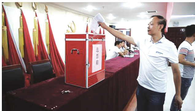
枫杨办事处召开机关工会委员会选举大会