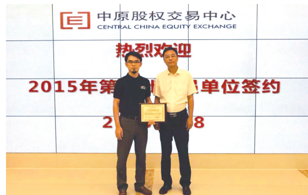
UFO创投取得中原股权交易中心推荐机构资格

中原股权交易中心是我省发展资本市场的重要载体和平台,将聚集企业、银行、PE、引导基金等投资机构,券商、会计师事务所、律师事务所等中介机构,推动政府指定支持挂牌企业政策等等,广泛吸收市场各要素快速向中心聚集,充分发挥区域资本市场服务实体经济的作用。