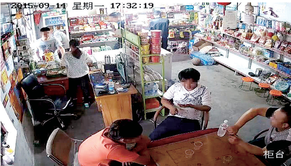
小超市也能现场直播