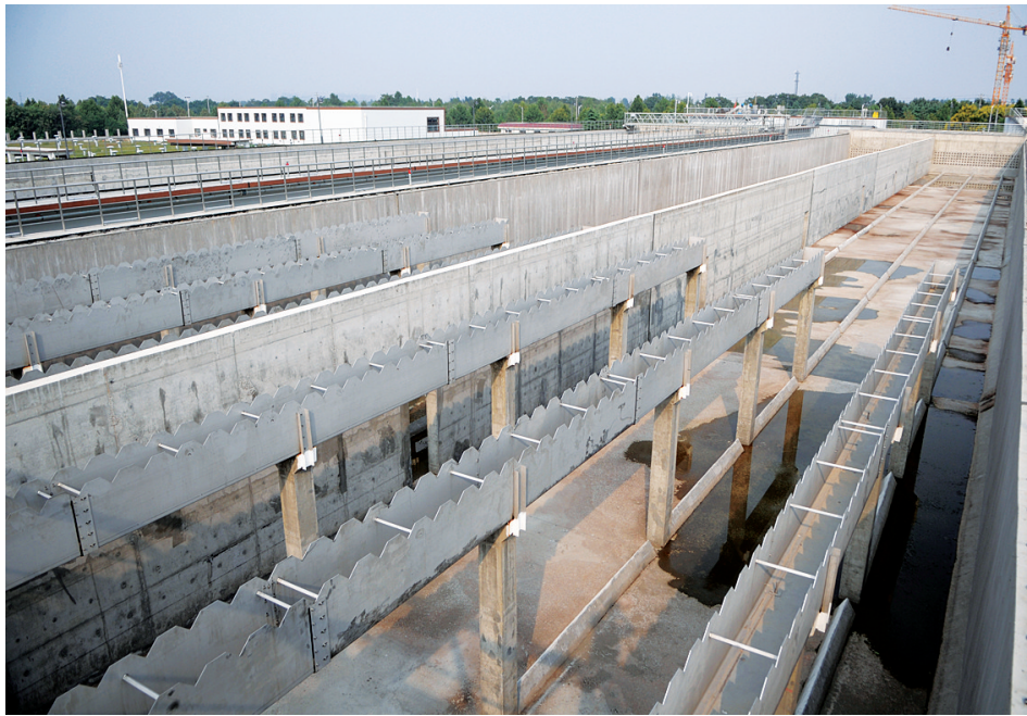
荥阳市罗垌水厂连接南水北调干渠管网已开通