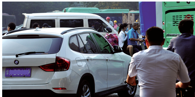
南阳路与农业路交叉口高峰时段十分拥堵

9月17日,本报开始“盘点郑州易堵路段”系列报道,让市民对易堵路段做到出行心中有数。今天咱们就说说近期交巡警五大队辖区的路况吧。