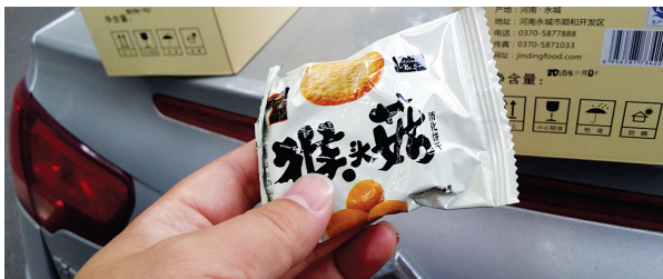
饼干内外包装生产日期不一致

双节临近,市民发现精心选购的猴头菇饼干内外包装生产日期相差5个月,生产厂家称将调查产品出现两个“出生证”的原因,但处理问题要到节后,监管部门建议消费者维权索赔。郑州晚报记者 汪永森 文/图