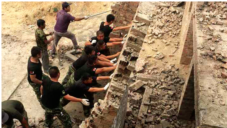
石佛办事处组织人员拆除违建楼房

本报9月15日A09版、9月18日A10版连续报道了有人偷偷在西流湖湿地建楼,因建楼地点处在两区交会处,造成管辖区不确定,9月17日市政府责成六部门到违建现场办公确权,最终确认违建地点归高新区石佛办事处。