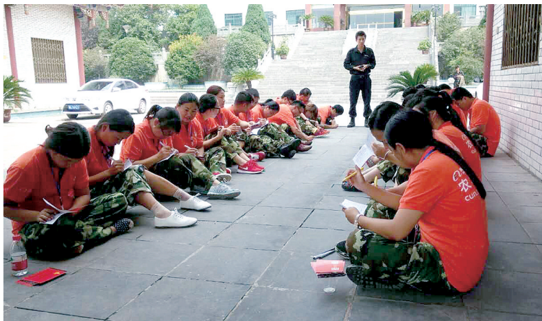
农村淘宝合伙人培训现场

务农民,创新农业,着眼于建设美好农村,提高管理和服务水平,推动文化资源优势转化为发展优势,全面提升文化旅游产业发展的质量,下一步,登封将加强与阿里巴巴集团的深度合作,借助国家大力发展农村电子商务的政策机遇,依托登封市电子商务创新创业综合体,全面推进互联网+思维,加快搭建市、乡、村三级服务网络,实现“网货下乡”和“农产品进城”的双向流通,形成买全球、卖全球的登封特色市场,不断拉动登封市经济产业转型升级,进一步推动登封这一世界历史文化旅游名城的国际化。