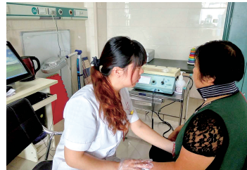
新郑市中医院康复分院医务人员指导患者康复