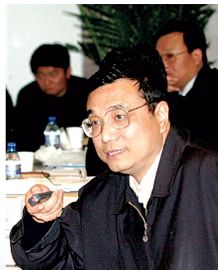
2003年 李克强到郑东新区调研