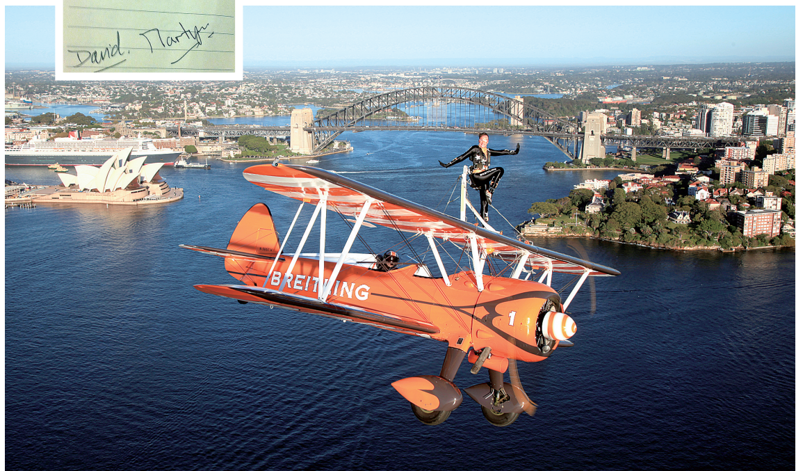
机翼上“空中漫步”到中国，上街上演首秀

这些站立在机翼上“空中漫步”的女孩，将进行滚转、失速转弯、对飞闪避等特技表演，甚至在飞行时速高达240公里且两架飞机贴得最近时，完成高空击掌等惊险刺激的性能。