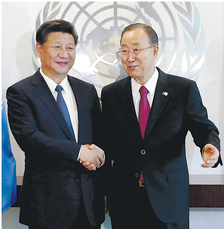
习近平会见联合国秘书长潘基文

国家主席习近平26日在纽约联合国总部出席联合国发展峰会并发表题为《谋共同永续发展 做合作共赢伙伴》的重要讲话,强调国际社会要以2015年后发展议程为新起点,共同走出一条公平、开放、全面、创新的发展之路,努力实现各国共同发展。