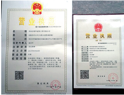
我市首张“三证合一”营业执照