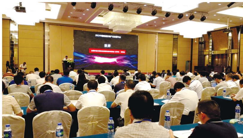
2015中国暖通空调产业发展年会现场