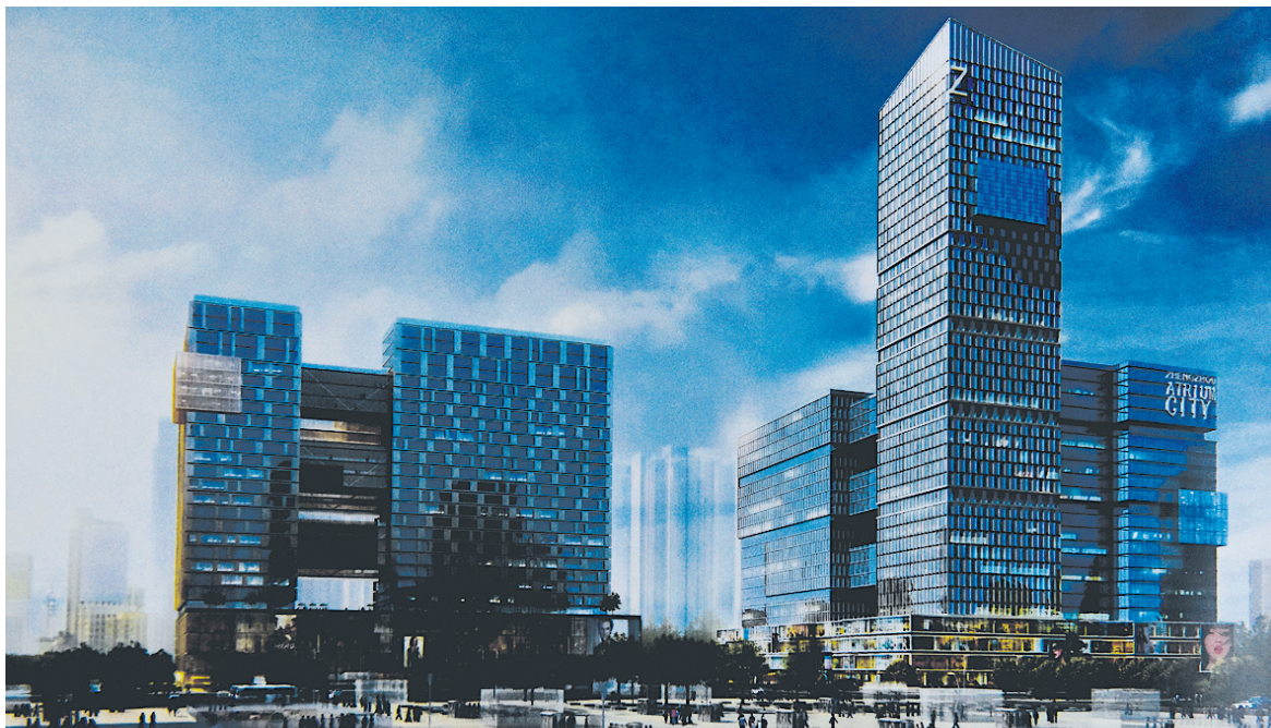
中央商务区项目D区商务中心规划图

火车站西广场周边将一改现有形象,建设集商业、金融、住宅等为一体的中央商务区,商业将以零售为主。目前,先行区已开始建设,经美国设计机构设计,先行区的商务区将有商业、住宅等。未来,站在西广场向南看,将是一栋高大的星级酒店。中央商务区将新规划多条道路,以缓解周边交通压力,并为东西广场互通提供便利。