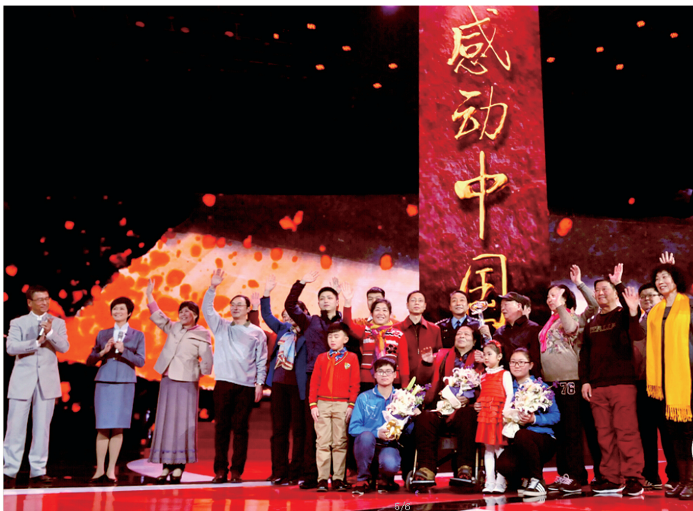
“陇海大院”获2014年感动中国

16个单位记集体三等功 40个单位为先进集体 30人记个人三等功 140名为先进个人