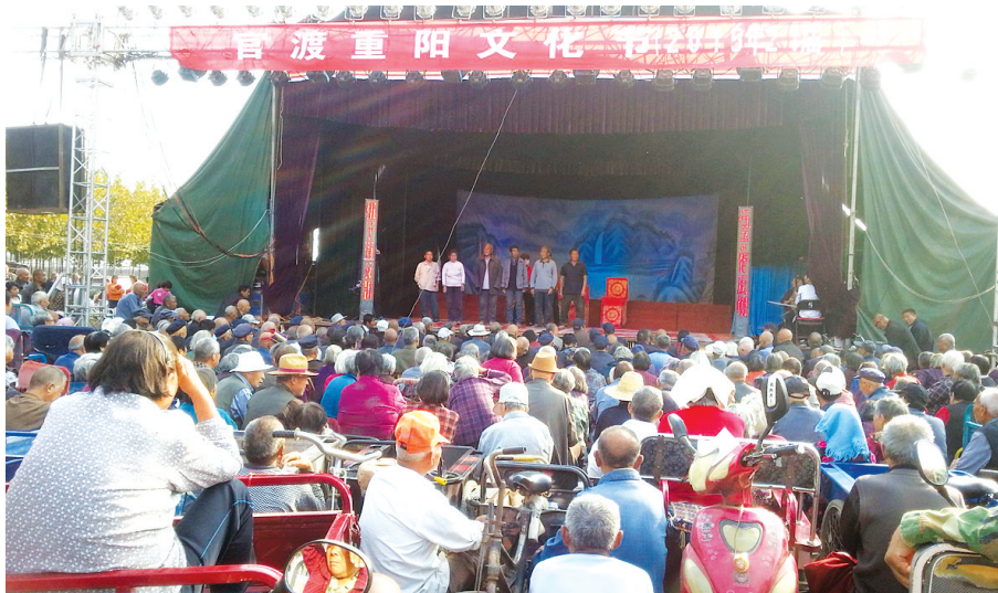
官渡桥村欢度重阳节