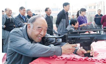
老干部运动会射击比赛

为丰富老干部的精神文化生活,中牟县在河南农业职业学院举办第十五届老干部运动大会。