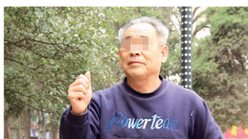
晨练，穿上走得快，真舒适！