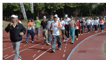
跟老友一起去健走，真幸福！