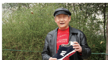
遛弯，穿上走得稳，真轻松！