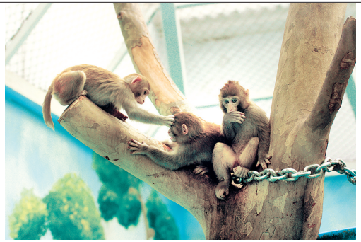
《瞧这一家子》