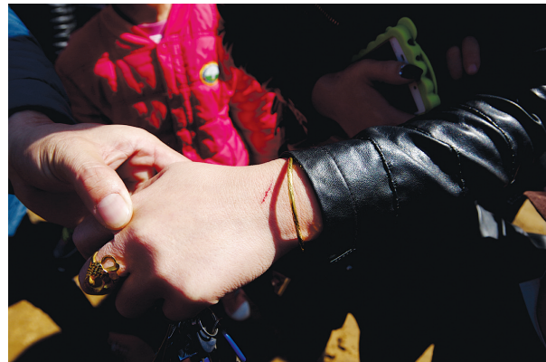
金手镯被剪断,牟女士手背被划伤

昨日,汝河路一农贸市场内,女子购物时遭遇别车“苦肉计”,手腕所戴金镯遭剪,手背也被划伤,市场管理员听到呼救狂追百米摀住一名抢劫人员。郑州晚报记者 汪永森 文/图