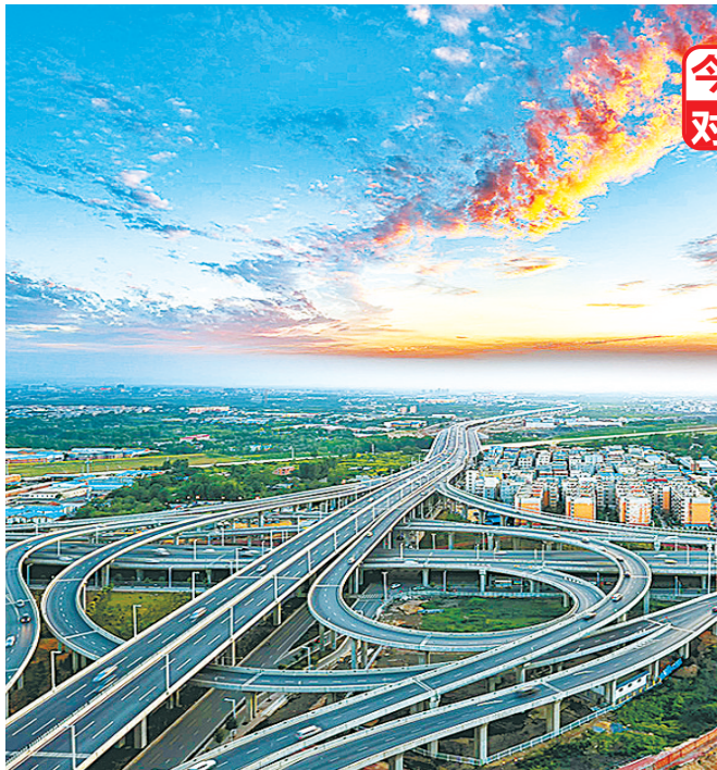
已通车的陇海路西三环互通式立交