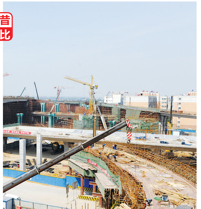
建设中的陇海路西三环互通式立交(资料图片)