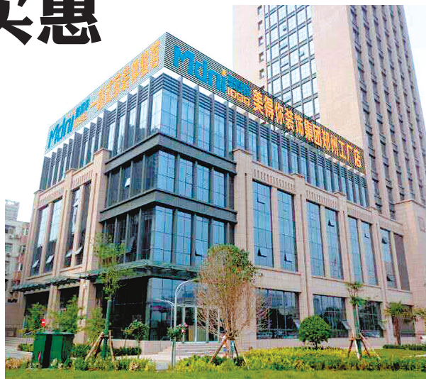
美得你装饰郑州工厂店