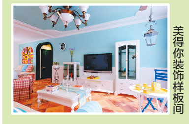
美得你装饰样板间