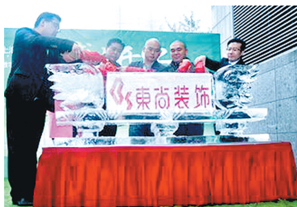
上海东尚装饰开业现场