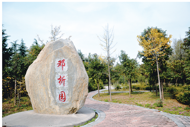
位于新郑市人民路北莲河西岸的邓析园

在邓析看来,辩论必须根据实际情况,不能任意胡说,否则就会带来祸患,特别是辩论必须要遵循一定的标准,所以“两可”虽然不失为一种辩说方法,但不可滥用。这就是诉讼程序要有规则,也就是最早的民事诉讼法!