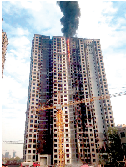
郑州晚报记者 徐富盈 汪永森 文/图 线索提供 岳先生(稿费50元)

起火的大楼属于冉屯村拆迁安置工程的一部分。中原区桐柏路办事处相关负责人称,这起火灾未造成人员伤亡,但墙体经火一烧,会不同程度损伤。下午5点钟左右,火才被控制住。民警将进一步调查原因。