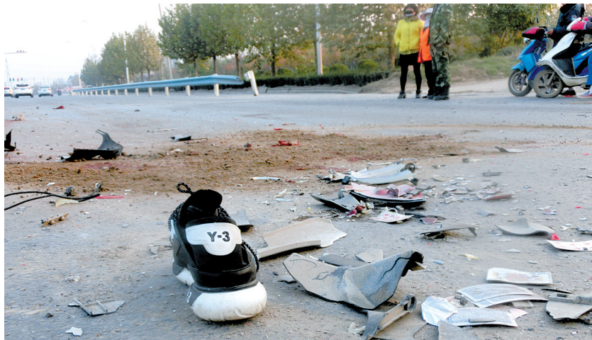
事故现场留下的一只运动鞋

事发现场位于西四环与连霍高速桥北侧200米左右,北距北四环与西四环交叉口约100米,由南向北的快车道内。西四环双向八车道正中间本来有一个钢护栏隔离,不让双向车道之间通行。但在事故现场,此段隔离钢护栏中间有一个宽约5米的缺