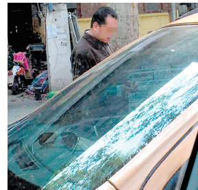
男子正在划车