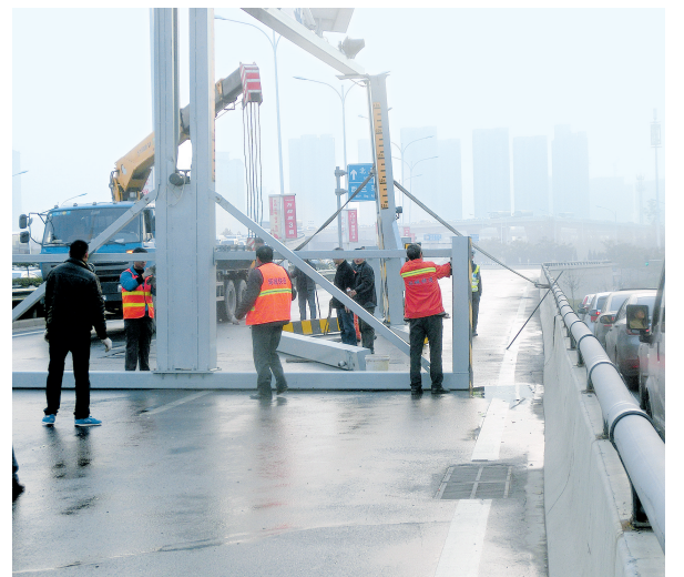
科学大道限高杆被撞

昨日清晨,科学大道由西向东的立交桥口处,一根限高杆被撞后毁坏,整个限高架被撞后向立交桥上移位了30米后停下,限高架横梁掉落下来将上桥口堵死。这已经是半月来第一百余次货车违章行驶撞上限高杆的事故。民警称,是加大处罚这些违章闯禁行的货车的时候了。