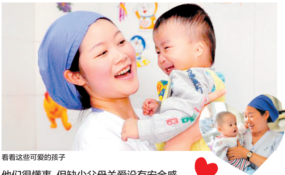
看看这些可爱的孩子