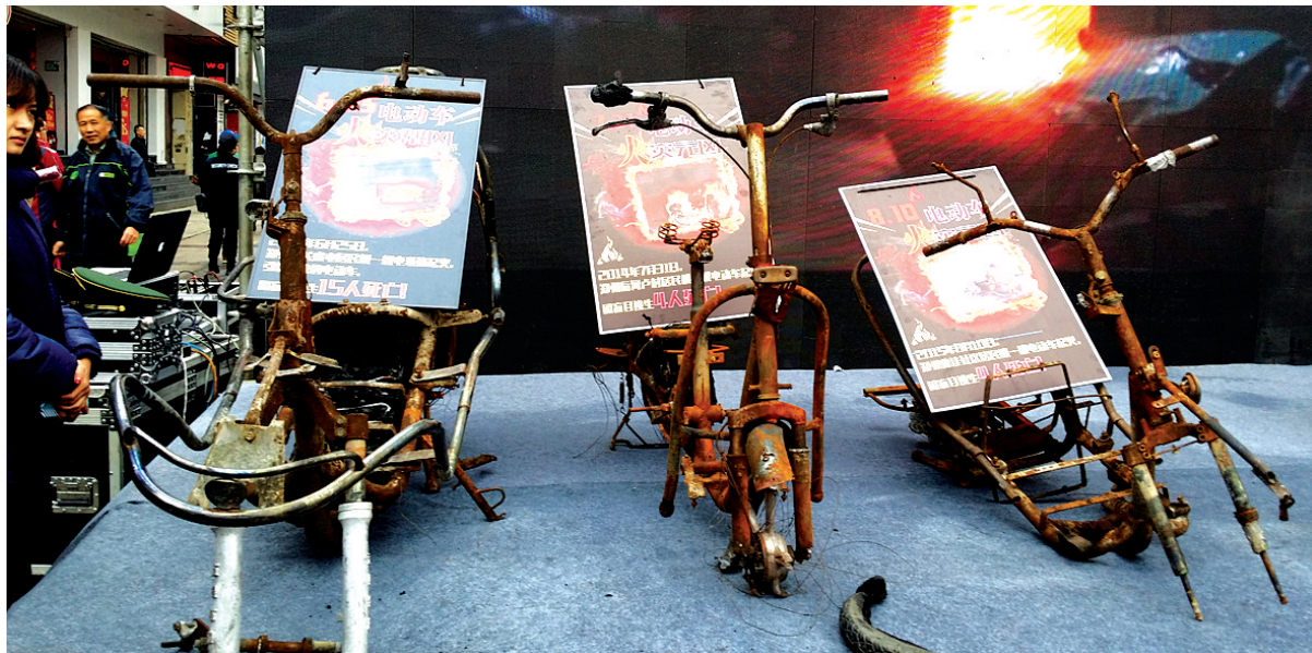
火灾事故中烧毁的电动车被搬至现场供市民参观

西单公寓、鸿鑫佳苑小区给出答案:办事处主动建充电棚 省公安厅:各小区都要因地制宜,用小设施解决大问题