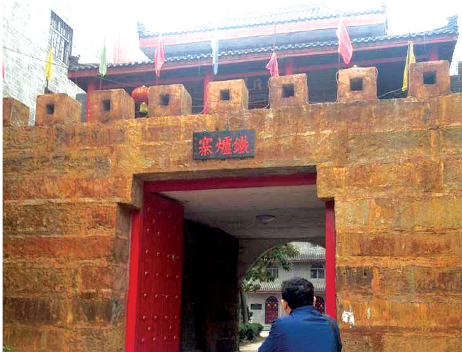
一公司院里的“铁炉寨”