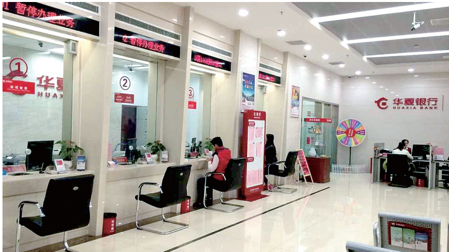
扎实做好每一个细节,满足客户各类金融需求。