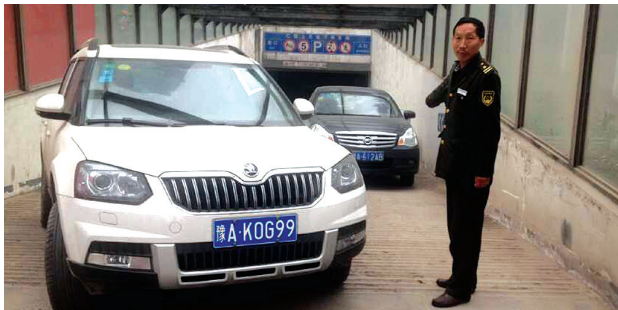
白色轿车堵在车库门口已3天