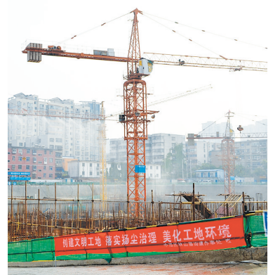
辖区重点项目建设工地塔吊喷淋设施

下一步,街道紧紧围绕以党建工作为统领,推进社区建设服务民生为主线,以“三严三实”专题教育为动力,实现党组织自身建设、党员教育管理、社区建设和服务民生建设三大工作突破,把长效机制融入“一号工程”,以网格化管理为战场,年内实现六个社区服务中心达1000平方米以上。在保障街道大气污染防治工作有效推进上,街道办将进一步在人力、物力、财力上加大投入,持续深入开展大气污染防治工作,不断致力提高城市空气质量,改善辖区形象面貌,营造整洁、有序、和谐的城市环境。