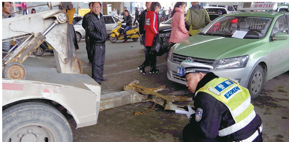
陇海快速路一层,违法停放的出租车被拖走

昨日,郑州交巡警三大队组织多辆拖车,对银基商贸城及钱塘街附近的陇海快速路一层存在的违法停车现象进行拖移整治。同时建议市民到该区域逛街购物多选择公共交通工具。