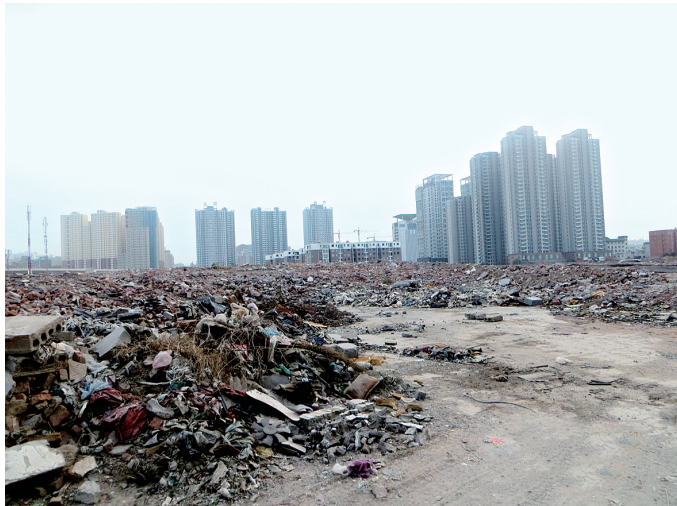
金水区黄家庵拆迁待建工地原貌