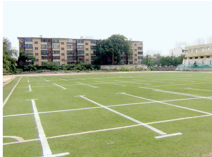
工地撒草籽绿化后,做临时停车场