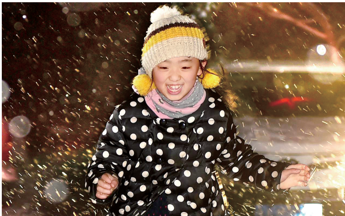
玩嗨了。于北环附近