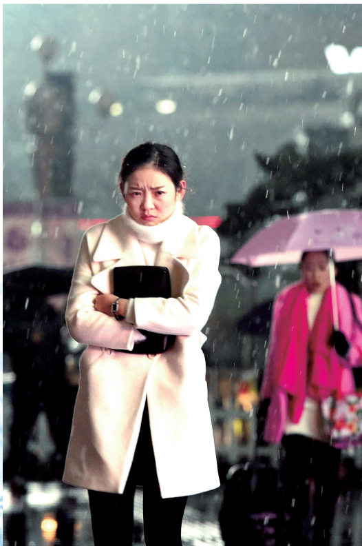
“美丽冻人”的姑娘。郑州晚报记者 马健 摄于郑州街头