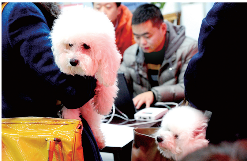
昨日,在普罗旺世小区社区服务中心,工作人员为居民的狗狗免费年检。

狗狗该年检了。金水区城市养犬管理工作领导小组办公室(下简称金水区养犬办)昨日下发通知,狗狗今年年检全部免费,年检截止时间为12月20日。逾期不年检的,查到的将被处罚。