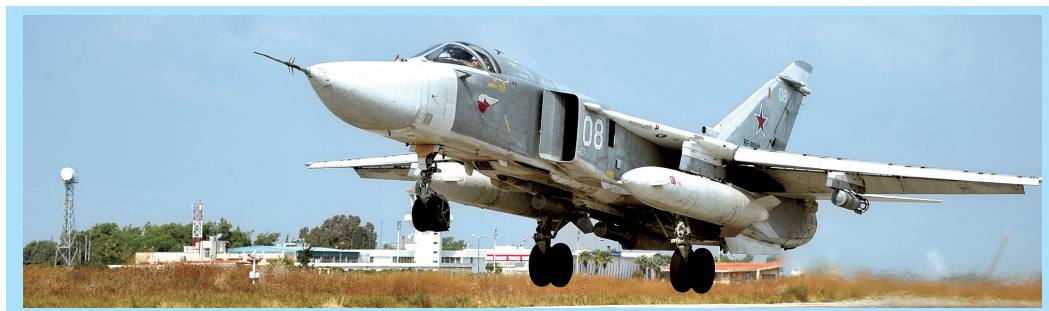
这是10月21日在叙利亚赫梅米姆空军基地拍摄的苏-24战机

俄罗斯一架苏-24(SU-24)战斗机24日在土叙边境叙利亚一侧坠毁。土耳其武装部队总参谋部说,土军方击落该架战机。俄罗斯方面则表示,这架战机遭到地面火力攻击,在叙利亚境内坠毁。