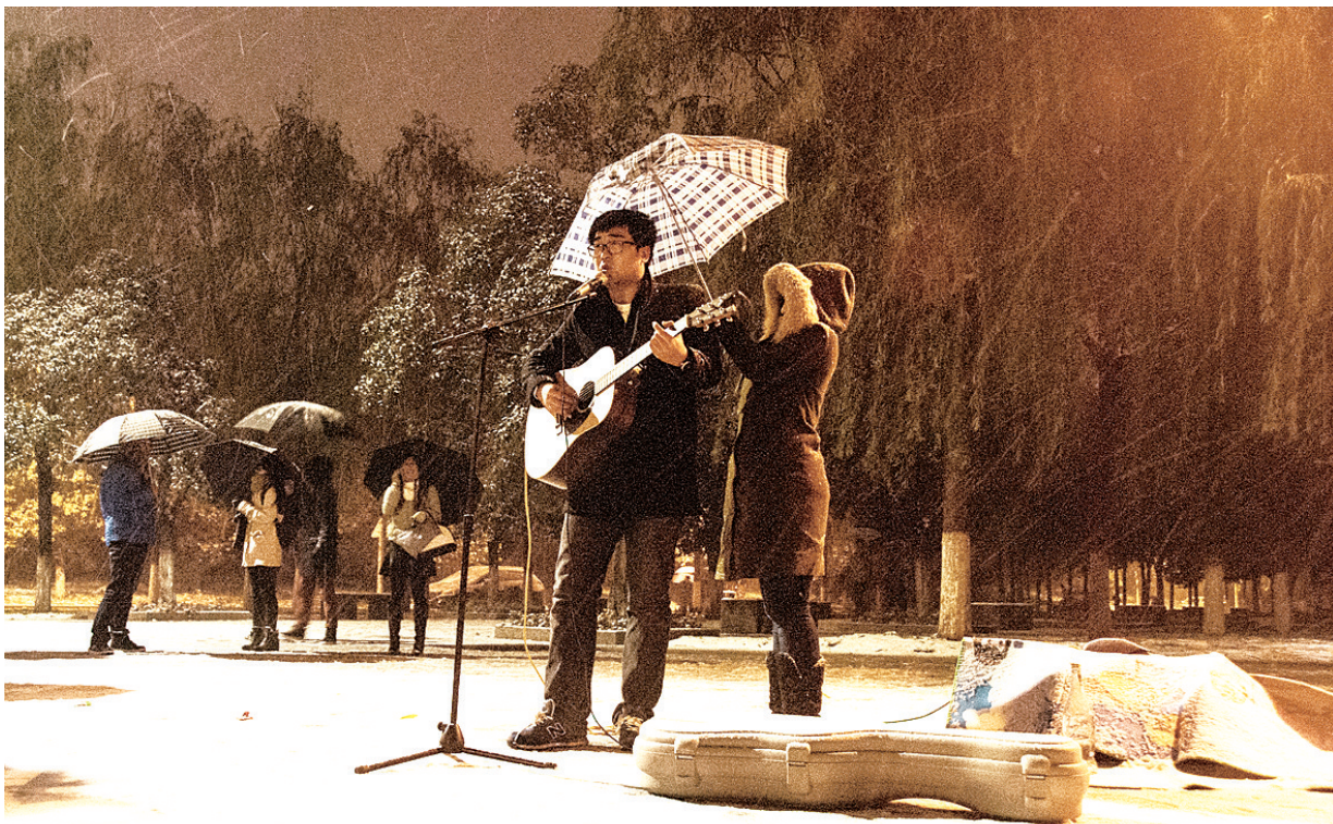
雪夜郑大新校区的这一幕是不是也温暖了你?