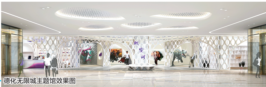
德化无限城主题馆效果图