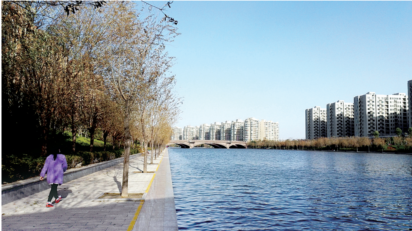
昨天下午,一位市民在郑东新区运河旁散步。

2015年12月3日 星期四 统筹:王长善 编辑:黄盈 美编:杨卫萍 校对:一广