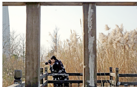
郑东新区人工湿地,摄影爱好者在取景拍摄