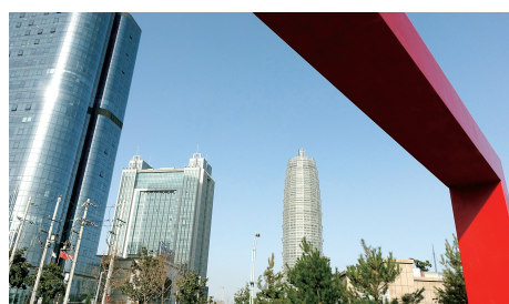
雾霾散去,天空放蓝