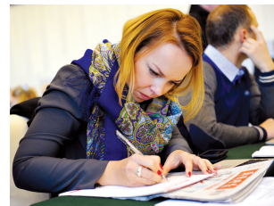
俄罗斯美女记者撰写祝福

哈萨克斯坦记者:我祝愿郑州这座美好的城市能够闻名世界,也期待世界人民能够感受到中国悠久的历史 and 灿烂的未来。