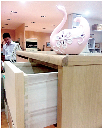
在东京展上,玉林木业公司的地板和家具受到消费者追捧

我一直期待着有一天能漫步在日本的街头、品尝日本料理、躺在榻榻米的和室里听屋后的溪水声……没想到幸福来得这么突然,直到下飞机的那一刻,我还觉得是在做梦。因为,无论是语言方面还是资历方面,比我优秀的人并不少。正如我对客户所说:“我是第一次来日本,从内心很感激公司领导给我这次机会”。