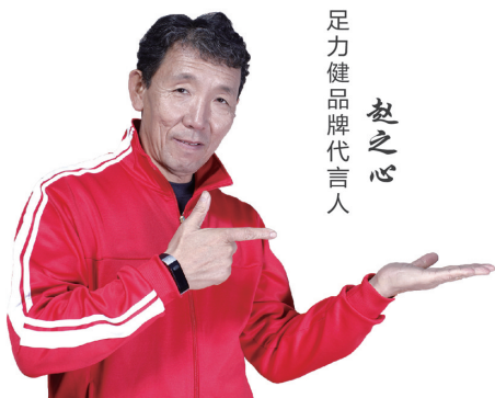
足力健品牌代言人 赵之心

郑州西站已开通公交线路,郑州乘坐12路、荥阳乘坐3路、上街乘坐郑上2路公交车,在中原路下车,步行500米即到。其中,12路公交车是郑州市区唯一一条经过郑州西站的公交线路,公交公司已对该车早晚高峰车次进行加密。郑州晚报记者 张华