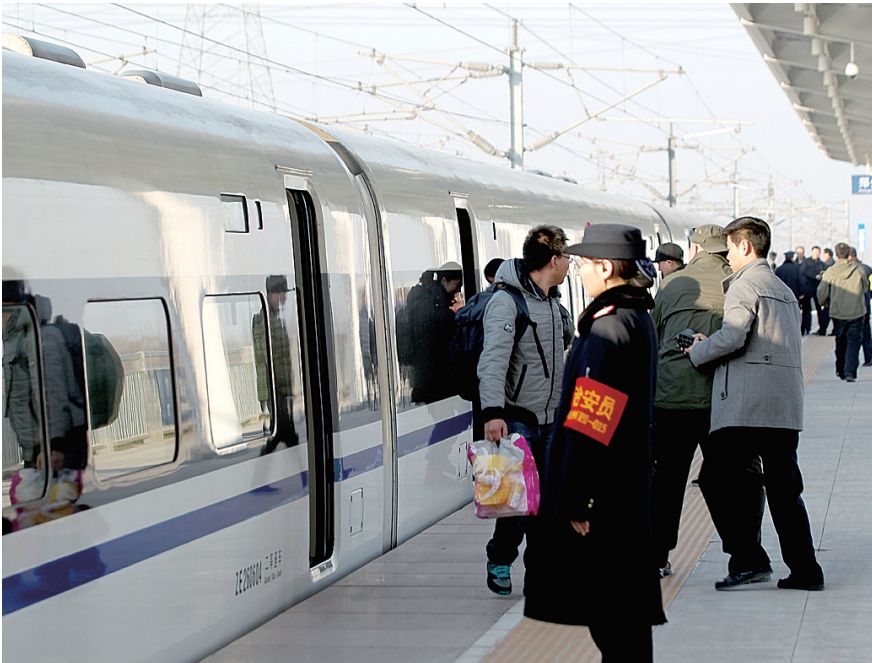
旅客们登上郑州西站首趟列车

昨日郑州西站正式开通运营。8点59分,从洛阳龙门驶来的G564缓缓驶入郑州西站,168名乘客顺利登上列车,开启高铁之旅。 郑州晚报记者 刘凌智/文 白韬/图