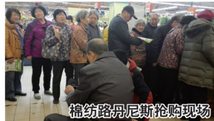
棉纺路丹尼斯抢购现场