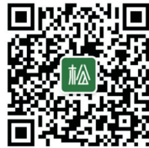
(扫描二维码关注 松社书店官方微信,支 持郑州原创文学)

秋深荷残,又一阵冷风吹进老院儿,老院儿里的花椒果子跟着风儿跳过院墙一起飞走了,墙头上的扁豆秧也黄了歇下了,惟有当院儿那几棵树木搭起的矮台上堆放着黄澄澄的玉米,精彩着老院儿的生活气息,这正是母亲想要的日子呢!(完)