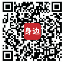
(扫描二维码关注 郑州晚报身边客户端, 了解更多征文详情)