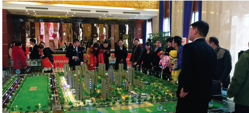
郑州西站的开通,带旺了近邻莱蒙郡房产的销售

随着京广高铁的通车运行,以及未来徐兰、兰新高铁的全线建成,“高铁郑州西站”将大大缩短周边地区与北京、广州、兰州、乌鲁木齐等高铁沿线城市的空间距离,带动区域经济社会升级发展。