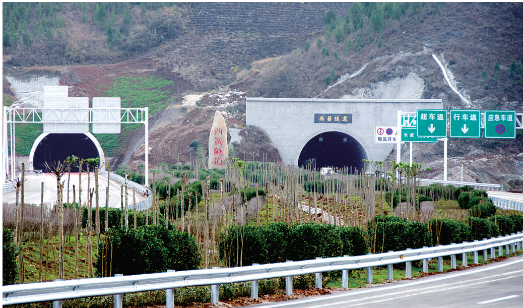
三浙高速桥隧比例超过五成

北起三浙高速灵卢段,经卢氏、西峡、淅川,终点与湖北省十堰至郧县高速公路相接,由河南省收费还贷高速公路管理中心出资建设的三浙高速公路卢氏至西坪段、西坪至寺湾段,于12月26日正式建成通车。这也是我省迄今为止,平均造价最高、桥隧比最高、施工难度最大的高速公路建设项目。