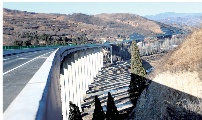
公路在崇山峻岭中绵延