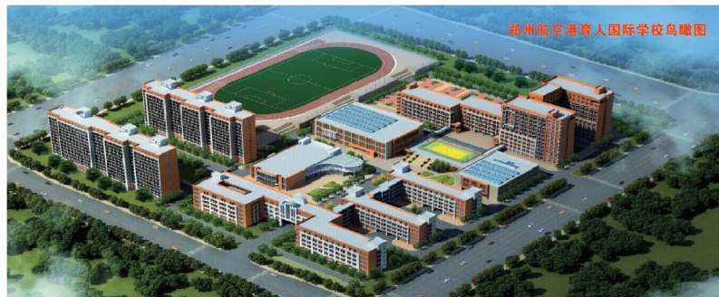
郑州航空港育人国际学校鸟瞰图