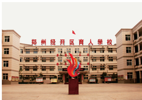
郑州经开区育人学校校部