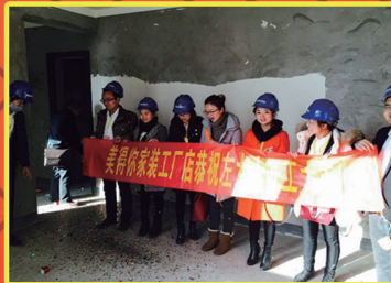
建业密码国际 左女士 “美得你让我装着放心、住着舒心。”