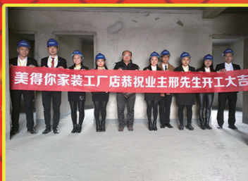
正商恒钻 邢先生 “省时省力，完全符合我的要求。”