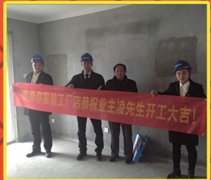
浩创梧桐郡 凌先生 “美得你可以让我省心、放心。”