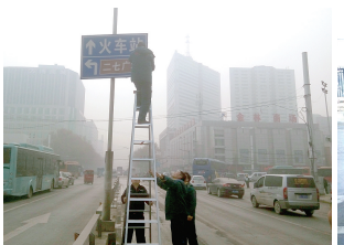
铭功路街道修复路牌标识