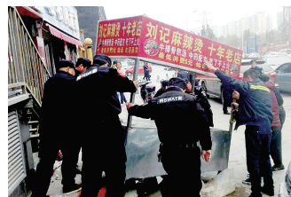
人和路街道清理占道经营

对违停车辆下发整改告知单,拆除私搭乱建建筑,完善车辆停放标识标线,随时补充划线,购买安放非机动车停车架,现已规划非机动车停车区域12800米。在万达停车场出入口处树立围挡,派专人值守,督促门店及辖区居民有序停放车辆,努力打造畅通交通。