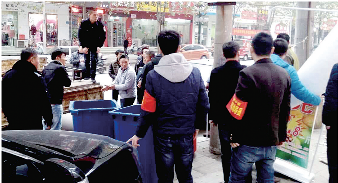
建中街街道整治突店经营

自开展城市精细化管理“百日行动”以来,二七区以建设畅通、整洁、有序的市容环境和天蓝、地绿、水清的城市环境为目标,重点解决辖区占道经营、突店经营、小广告乱贴乱画、垃圾乱堆乱放等城市环境“脏、乱、差”问题,辖区城市精细化管理水平不断提升,市容乱象得到明显改善。 记者 李佳露 文/图