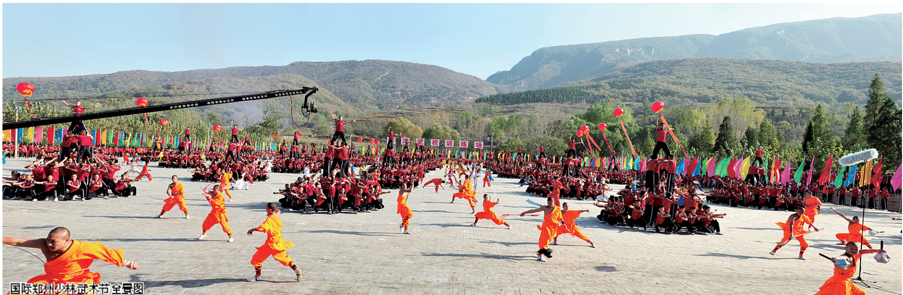
国际郑州少林武术节全景图

“十二五”期间，登封建设世界历史文化旅游名城的“水”已经涨了起来，“十三五”期间，只待“船高”。登封有文化的满天星星，璀璨着嵩山上空，有文化产业的万马奔腾，促进着登封的腾飞，登封在建设以华夏历史文明传承创新示范工程为主导的世界历史文化旅游名城道路上，阔步向前！